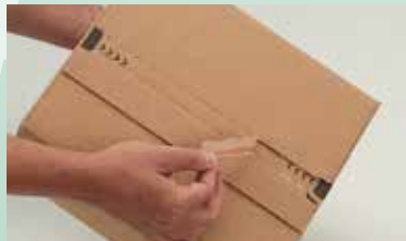
sicheres Öffnen mit progress-Aufreißfaden