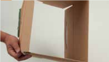
... danach umformen