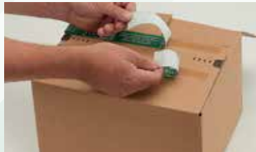
bei gewünschter Sicherheitsverklebung beide Abdeckstreifen abziehen ...