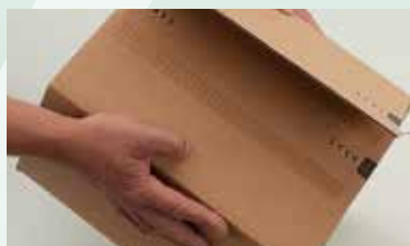
... und mit progress-Selbstklebeverschluss verschließen