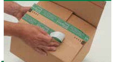
den zur anlenkenden Außenseite angebrachten Abdeckstreifen abziehen ...