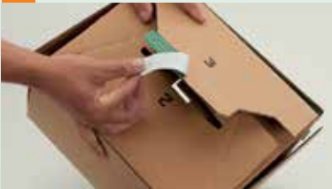
Bodenlaschen nach innen, Verschlusslaschen mit progress-Selbstklebeverschluss verkleben