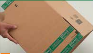
flach liegenden Karton umfalten