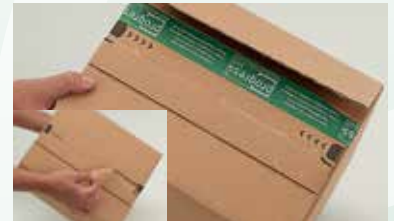
mit dem oberen progress-Aufreißfaden öffnen