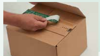
mit zweiten progress-Selbstklebeverschluss verschließen und retournieren