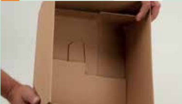
die Einstecklasche verklebt fest mit dem Boden, dadurch extreme Stabilität der Karton ist jetzt einsatzbereit