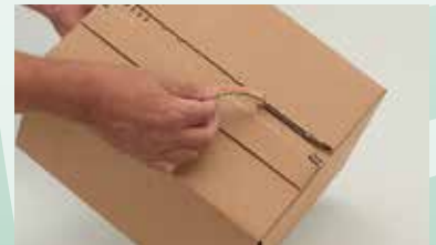
zum Öffnen den zweiten progress-Aufreißfaden verwenden