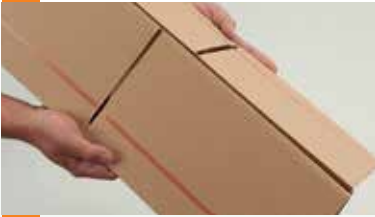
obere Verschlussklappen nach unten falten ...