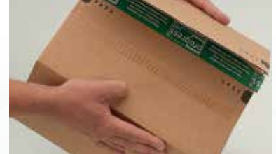
... und mit progress-Selbstklebeverschluss verschließen